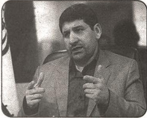
ایجاد می کند.

صدا و سیما نگران حجاب در دانشگاه ها شده در حالی که به خود نمی پردازد