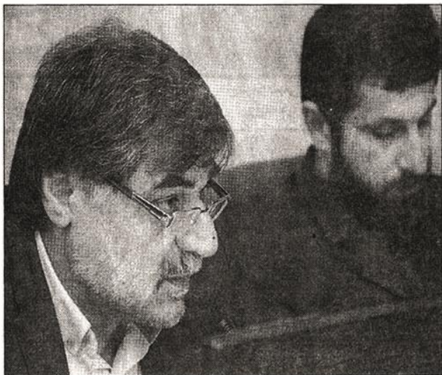
منجر شود و مسئولان اجرایی کشور نیز از نتیجه‌گیری‌های علمی آن استقبال کنند و راهکارها را برای رفع معضلات به کار بگیرند. چشم‌انداز - شنبه ۲۱ اسفند ۹۵

بنا راهکارهای علمی بر مسائل و مشکلات موجود فائق آیندوی ابزار امیدواری کرد که این نشست‌یه نتایج و راهکارهای مناسبی