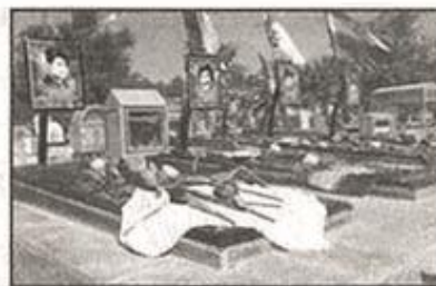
غبارروبی دانشجویان دانشگاه شهید چمران از مزار شهدا

علاوه مندان به حضور در این مراسم می توانند با مراجعه به کانون شهدا و عاشورا واقع در معاونت فرهنگی و اجتماعی دانشگاه، ثبت نام نمایند. نورخوزستان ۱۸ آذر ۹۴