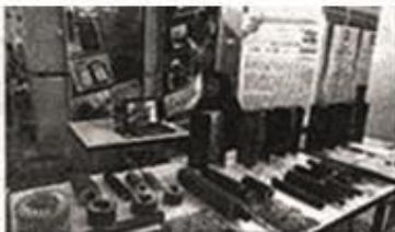
رییس دانشگاه شهید چمران