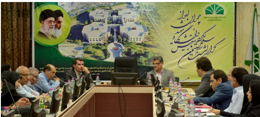
عضو هیئت علمی دانشگاه شهید چمران اهواز از تدوین برنامه راهبردی شهرداری آبادان در این دانشگاه خبر داد.