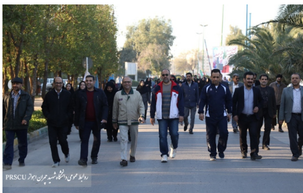
روادان هیئت‌علمی، دانشجو، و کارکنان دانشگاه شهید چمران اهواز

به مناسبت فرارسیدن چهلمین سالگرد پیروزی انقلاب اسلامی ایران همایش بزرگ پیاده‌روی دانشگاهیان امروز چهارشنبه ۱۷ بهمن ماه از محل کوی استادان برگزار شد. در این همایش کارکنان و اعضای هیئت‌علمی دانشگاه به همراه خانواده‌ها حضوری پرشور داشتند. در پایان نیز به قید قرعه هدایایی به شرکت‌کنندگان اهدا شد. پیش از این همایش نیز دانشگاهیان شهید چمران اهواز با حضور در یادمان شهدای گمنام دانشگاه با آرمان‌های بنیان‌گذار جمهوری اسلامی ایران و شهدای پیش از انقلاب و هشت سال دفاع مقدس، تجدید پیمان کردند.