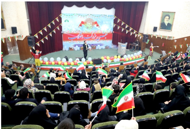
چمران اهواز، محکوم کرد.

رئیس دانشگاه شهید چمران اهواز، بیان کرد: امیدواریم دانشگاهیان شهید چمران اهواز در سالن شهید مطهری و این حادثه را نیز از سوی جامعه دانشگاهی شهید بردارند. دانشگاه شهید چمران اهواز با سابقه آموزشی، علمی و پژوهشی که دارد می‌تواند نقش موثری در توسعه کشور و استان خوزستان داشته باشد. خواجه همچنین از تمامی کسانی که برای برپایی جشن بزرگ انقلاب در دانشگاه تلاش داشتند، تقدیر کرد. گفتنی است برگزاری مسابقه نقاشی ویژه کودکان، اجرای تئاتر، موسیقی و... از بخش‌های مختلف این جشن بود.